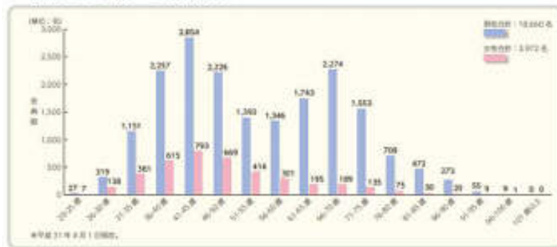
■ 司法書士年齢別・性別構成表

司法書士は全国で22,632名(平成31年時点※1)が活躍しています。また、男女の内訳は男性18,660名で82.4%、女性は3,972名で17.6%となっています。平均年齢は53.4歳、最年少は23歳、最年長は98歳であり、年代は40歳代が6,728名(29.7%)と最も多く、60歳代は4,175名(18.4%)、30歳代 3,927名(17.4%)の順となっています。